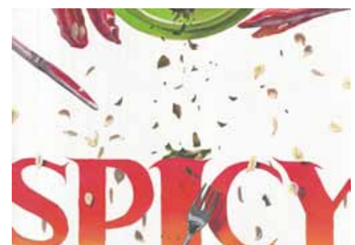
参考作品 上・平面構成 下・平面構成

東京藝術大学に設置されているデザイン科・工芸科を志望する学生のためのコースです。デッサンを中心に基礎を確実に身につけ、本人の持つ感性をさらに伸ばしていきます。講習会の最後には、3校合同コンクールを行います。いつもとは違う緊張感の中、講習会で身につけた実力を試みましょう。