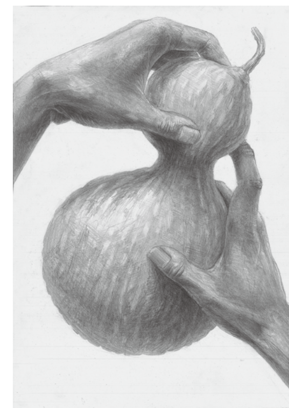
参考作品 構成デッサン

主に多摩美術大学・武蔵野美術大学等の私立美大へ進学を志望している学生のためのコースです。多摩美術大グラフィックデザイン学科、多摩美術大プロダクトデザイン学科、武蔵野美術大視覚伝達デザイン学科、武蔵野美術大工芸工業デザイン学科等を対象としたカリキュラムで構成されています。