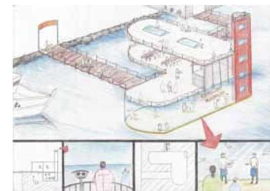
筑波大学芸術専門学群建築デザイン学科 合格再現作品 総合表現