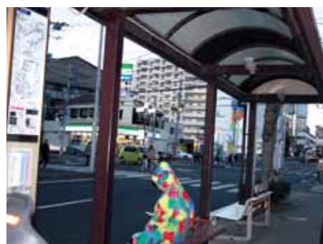
参考作品 自主テーマ作品