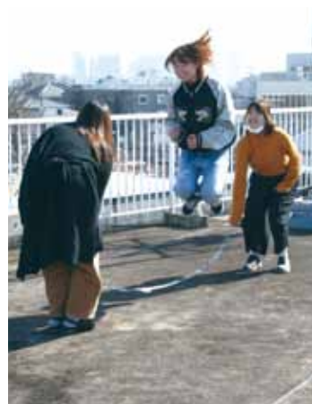
参考作品 自主テーマ作品

東京藝術大学先端芸術表現科や武蔵野美術大学映像学科、京都精華大学マンガ学科等の映像に関する学科やアニメ・マンガに関する学科を志望する学生のためのコースです。基本的なデッサン対策から、映像科試験で多く出題されるイメージデッサン課題等を中心に取り組んでいきます。