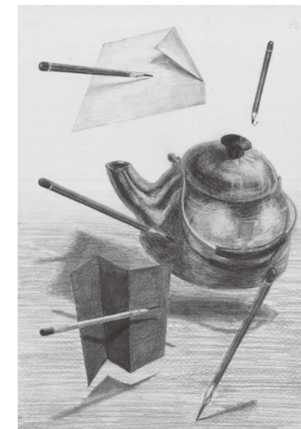
首都大学東京システムデザイン学部 システムデザイン学科 合格再現作品 構成デッサン

*カリキュラム内容は変更することがありますので、予めご了承ください。 *初心者の方は始めに導入のための基礎課題を行います。