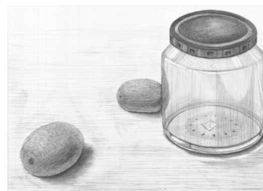
筑波大学芸術専門学群建築デザイン学科 合格再現作品 卓上デッサン