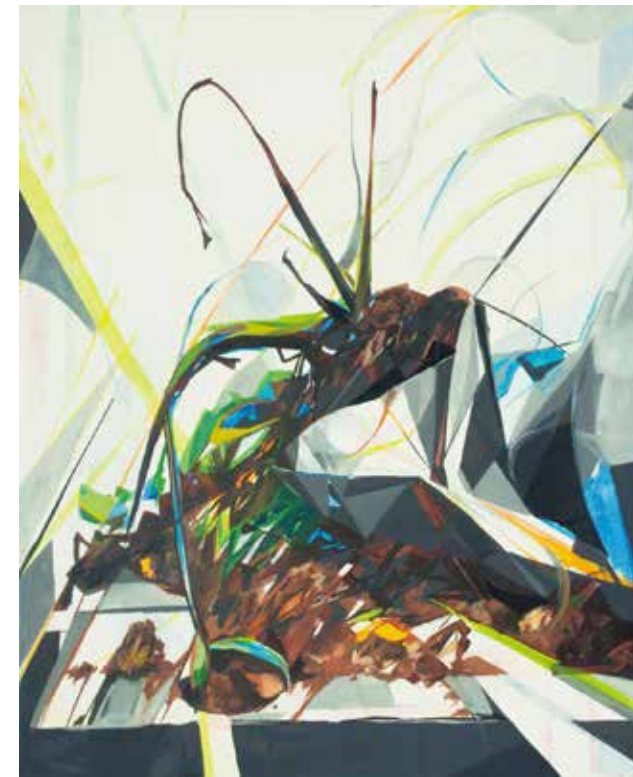
参考作品 絵画表現

*A期では、学校の都合により受講が難しい現役生は日割の受講も可能です。各校事務局にお問い合わせください。