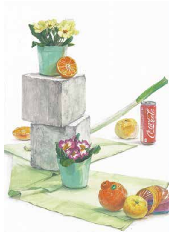
参考作品 静物着彩