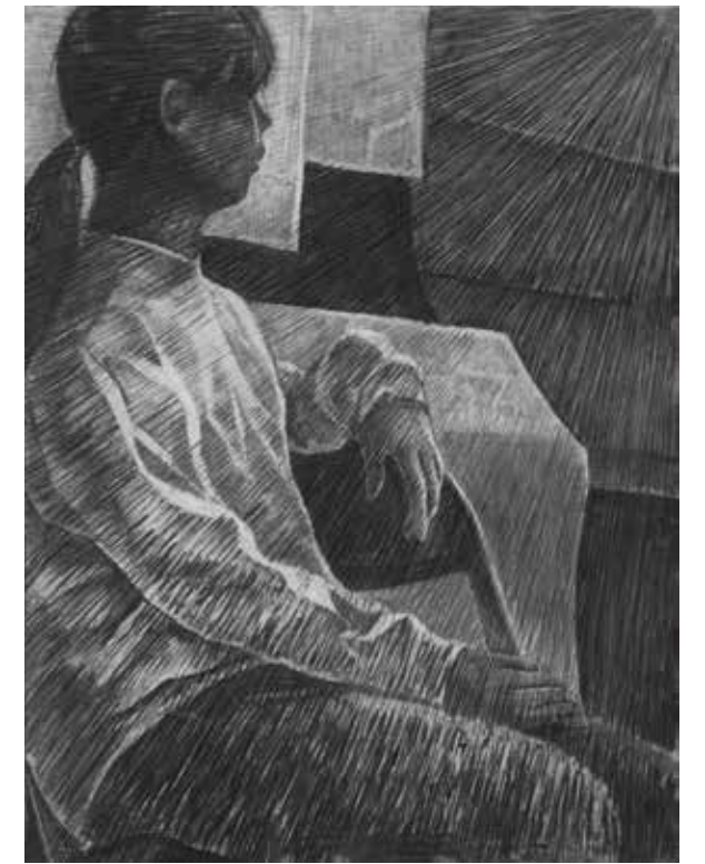
参考作品 人物デッサン

東京藝術大学絵画科油画専攻、武蔵野美術大学油絵学科油絵専攻・版画専攻、多摩美術大学絵画学科油画専攻・版画専攻等を志望する学生のためのコースです。全期を通じて基礎力の充実と自己表現の模索を目標とした内容となっています。多様な課題を通じ、自分自身とじっくり向き合います。講習会最後の3校合同コンクールでは、入試さながらの実技審査が行われます。揺るぎない表現の土台を築き、自信を持って受験に臨む体制を整えましょう。