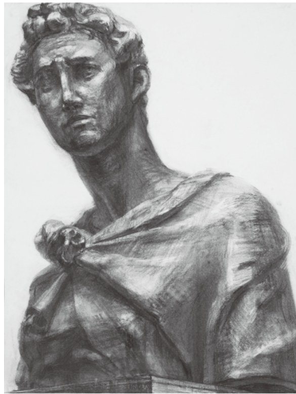
参考作品 石膏デッサン