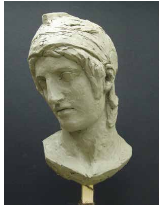
参考作品 石膏像模刻

東京藝術大学彫刻科、武蔵野美術大学彫刻学科、多摩美術大学彫刻科等を志望する学生のためのコースです。上手に描ける。上手に作る。をしっかりと確認しつつ、自分のイメージをしっかりと表現できるよう、己のリアリティーを追求する力を養います。客観性とは何かを常に確認しながら、単なる作業的な仕事にならないように、各自、表現する形に自信を持って、受験に臨む体制を整えましょう。