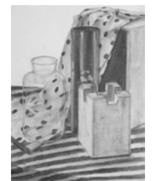
左:参考作品 卓上デッサン 右:千葉大学 教育学部中等教育教員養成課程美術科 合格再現作品 静物デッサン