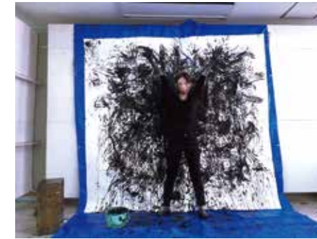
参考作品 自主テーマ作品