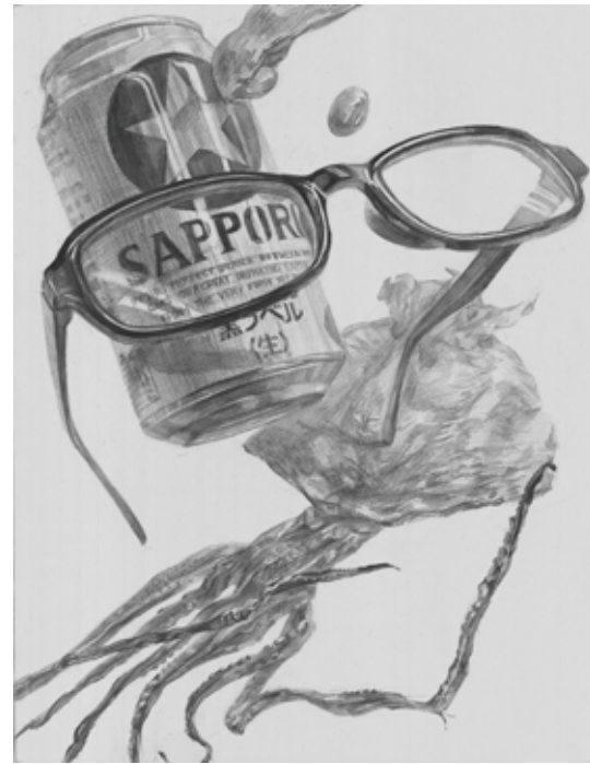
参考作品 構成デッサン