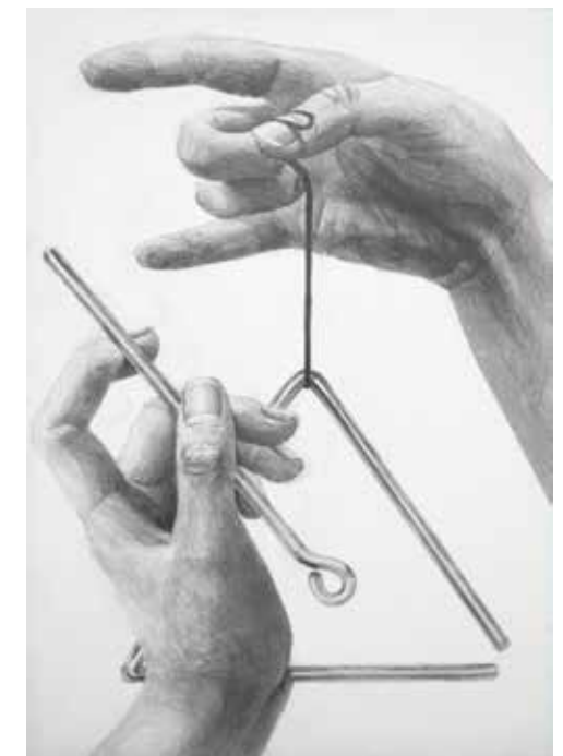
合格再現作品 構成デッサン

主に多摩美術大学・武蔵野美術大学等の私立美大へ進学を志望している学生のためのコースです。多摩美術大グラフィックデザイン学科、多摩美術大プロダクトデザイン学科、武蔵野美術大視覚伝達デザイン学科、武蔵野美術大工芸工業デザイン学科等を対象としたカリキュラムで構成されています。