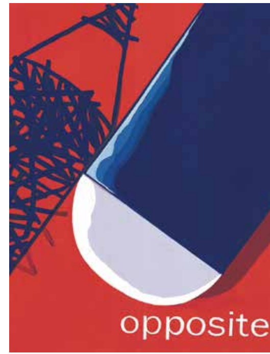
参考作品 平面構成

※1期では、学校の都合により受講が難しい現役生は日割の受講も可能です。各校事務局にお問い合わせください。 ※カリキュラム内容は若干異なることがありますので、予めご了承ください。