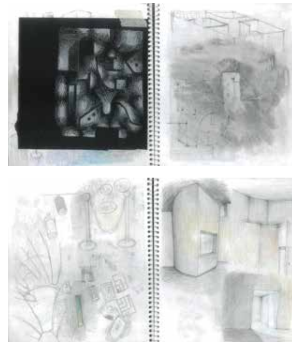
参考作品 ドローイング

※1期では、学校の都合により受講が難しい現役生は日割の受講も可能です。各校事務局にお問い合わせください。 ※カリキュラム内容は若干異なることがありますので、予めご了承ください。