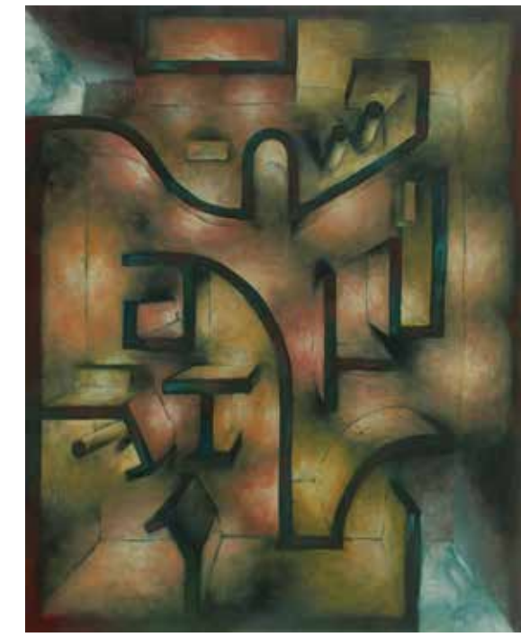
参考作品 油彩表現

東京藝術大学絵画科油画専攻、武蔵野美術大学油絵学科油絵専攻・版画専攻、多摩美術大学絵画学科油画専攻・版画専攻等を志望する学生のためのコースです。全期を通じて基礎力の充実と自己表現の模索を目標とした内容となっています。多様な課題を通じ、自分自身とじっくりと向き合きましょう。講習会最後の3校合同コンクールでは、入試さながらの実技審査が行われます。揺るぎない表現の土台を築き、自信を持って受験に臨む体制を整えましょう。