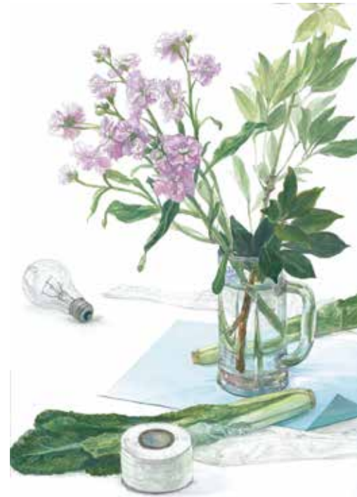
参考作品 静物着彩