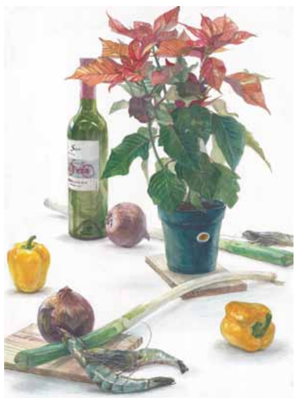
参考作品 静物着彩