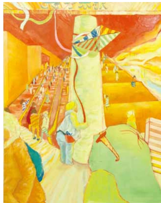
参考作品 絵画表現

*A期では、学校の都合により受講が難しい現役生は日割の受講も可能です。各校事務局にお問い合わせください。