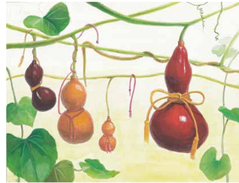
高校1・2年生コース参考作品 構成着彩