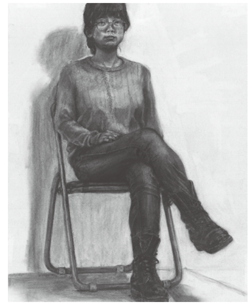
高校1・2年生コース参考作品 人物デッサン